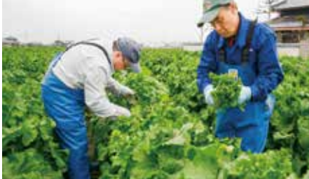
今作のナバナは、約8トンを出荷する見込み