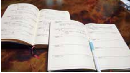
平成30年から続ける5年日誌