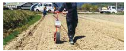
シーダーテープ（写真左）を利用して播種労力軽減