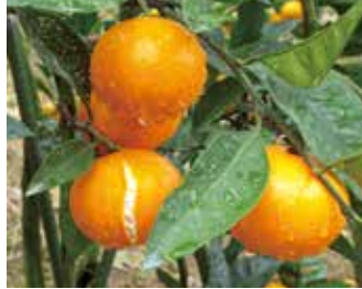
降雨で裂果したうんしゅうみかん

令和5年は台風到来の少ない年でしたが、夏場の高温といった気象災害や病害などで次の通り共済金をお支払いしました。 水稲は、移植期に水の管理が難しい水田でスフミリンゴガイの食害が発生。台風7号や局地的な豪雨で倒伏する風水害、山間部を中心にイノシシの被害が発生し、一部皆無の耕地がありました。 大豆は、高温乾燥と台風7号の風雨で落葉し着莢不良や、一部では虫害で大きな被害となりました。