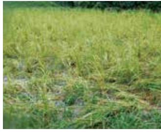
イノシシに踏み荒らされた水稲

令和5年は香川県の年平均気温が、史上最高を記録しました。6年も気温が高い状態が続くと予測されています。農業保険に加入し、予期せぬ災害に備えましょう。