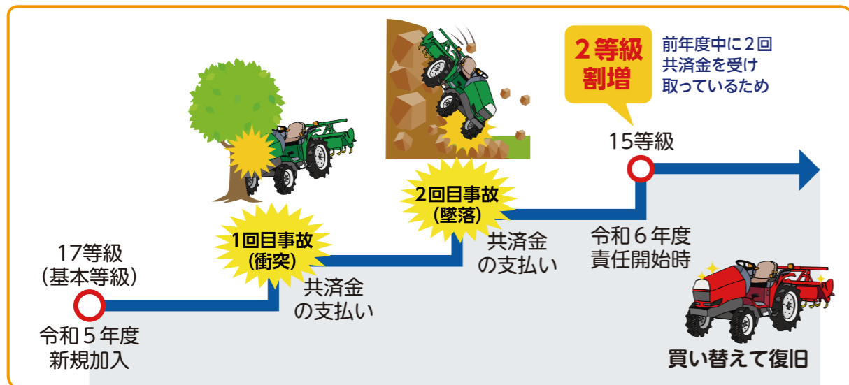
(図3) 新割増等級の適用例