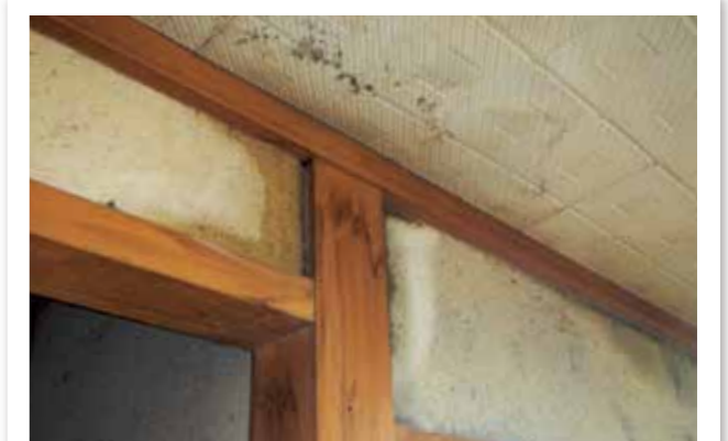
屋根瓦の破損で天井と内壁に水濡れ損

NOSA Iの建物共済には、火災共済と総合共済があります。 火災共済 で地震や台風被害は補償できません。火災だけでなく 自然災害 も補償する 総合共済 への加入をおすすめします！