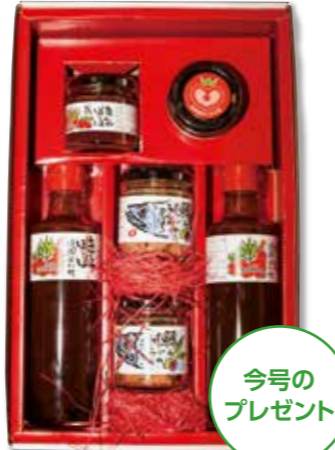
今号のプレゼント

正解者の中から抽選で 8名 の方に、多度津さくら工房(多度津町)の ギフトセット (きしゃぼっぽ焼き肉のたれ300ml、きしゃぼっぽジャム80g、鯖とオリーブのふんわりそばろ60g 各2個)をお届けします。多度津町特産のミニトマトとオリーブをふんだんに使った、手作りの味をお楽しみください。たくさんのご応募お待ちしております。