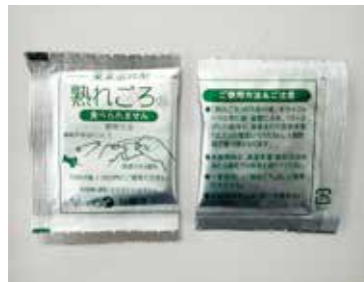
果実追熟剤 (JAやインターネットなどで販売)

果実が硬いまま流通しているものが多く、「食べ頃にする方法が分からない」という声をよく耳にします。今回は追熟のコツを紹介します。