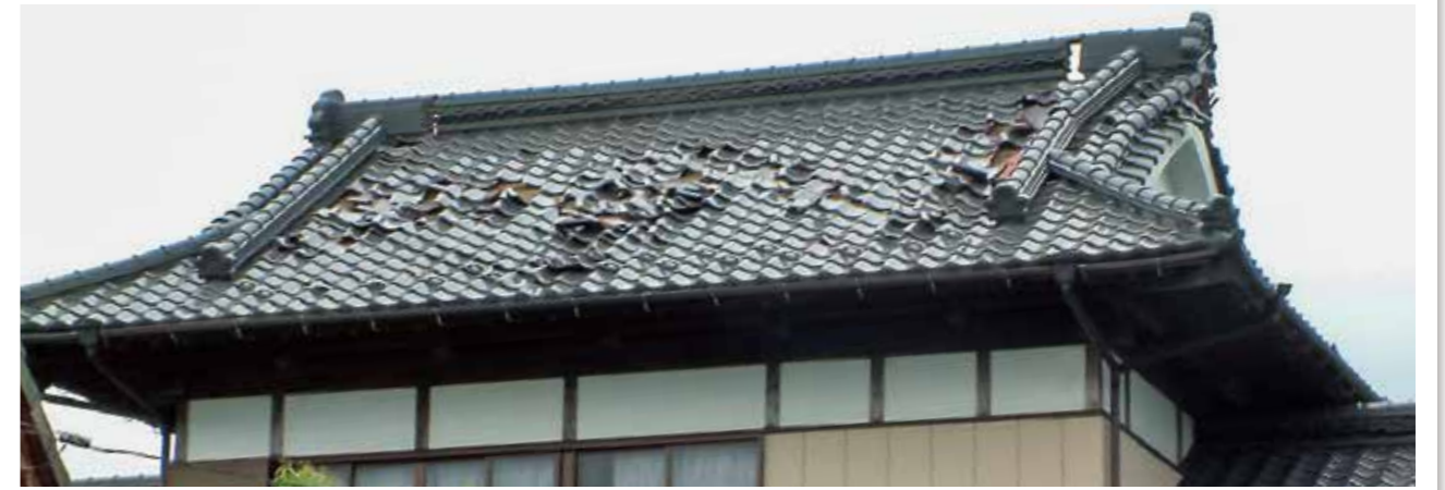
強風で屋根瓦が破損