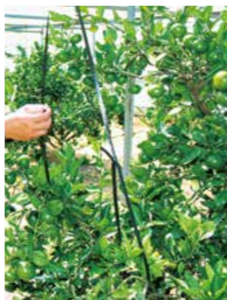
枝釣り。果実の重みで枝が折れないよう保護する大切な作業

安全・安心なミカンを食卓へ 主力品種の温州ミカン「宮川早生」の園地1畝は、23年から有機で栽培する。有機農産物の日本農林規格で認められているマシン油乳剤剤