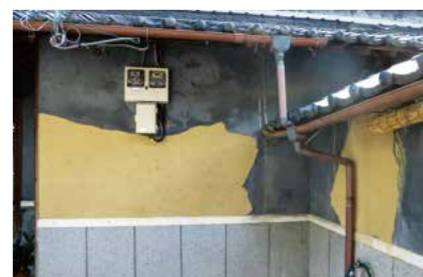
台風で土壁が剥離