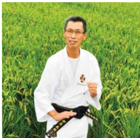
「少林寺拳法も農業も、日々勉強しながら頑張ります」